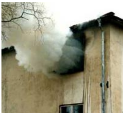
I Sverige är skyldigheten att ingripa inte reglerad i lag.