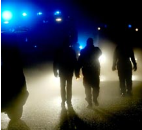
Minnesbilderna av olyckan lever med Henrik. "Jag tänker på det ofta", berättar han.