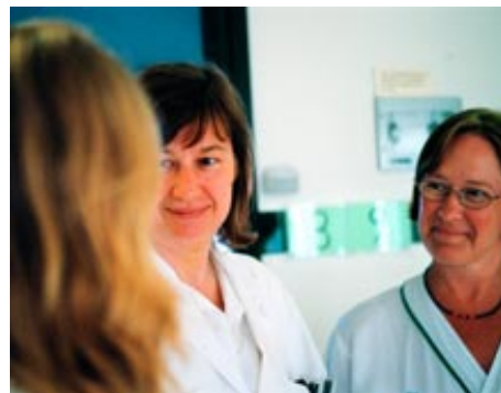
Sjukhusens krisgrupper är till för att hjälpa de drabbade och anhöriga. Personerna på bilden har inget samband med texten.

Vid större olyckor och katastrofer aktiveras ofta två grupperingar med professionella stödpersoner för att hjälpa drabbade. Vid sjukhusen upprättas krisgrupper som kan ge stöd till drabbade och anhöriga till skadade som vårdas på sjukhus.