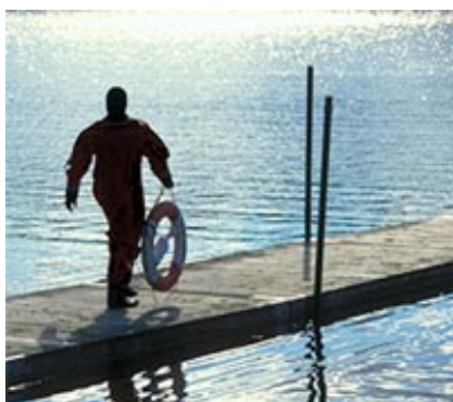
Om du kommer först till en olycka har du enligt lag bara en enda skyldighet: att larma.

- Om du råkar tända eld på ett hus eller råkar knuffa någon i vattnet så är du skyldig enligt lag att hjälpa till och försöka minimera de skador du vållat, säger Torkel Schlegel.