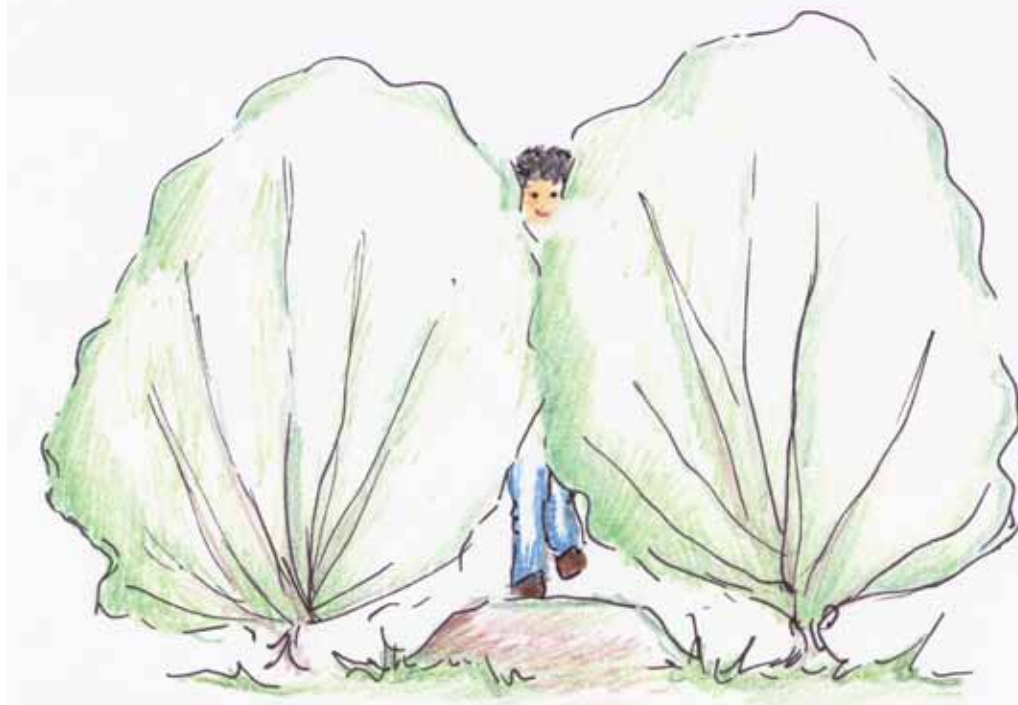
ILLUSTRATION: CATRINE HOVANTA & LISA GRÖNBERG

– Kan mycket väl tänka mig att betala det de begär men då skulle jag vilja vara garanterad en plats också. Tycker även att man snålar med motorvärmarna. För dyra pengar vill jag ha bra värme.