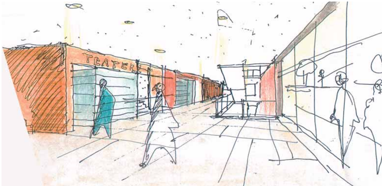
ILLUSTRATION: MEROM KIRCHMEIER ARKITEKTER AB